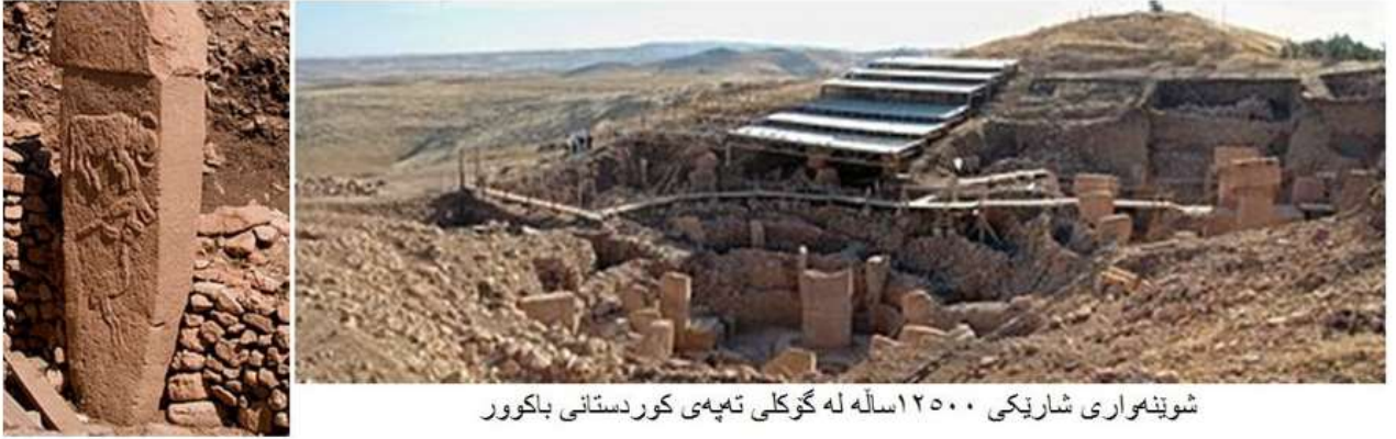
شونیهواری شاریکی ۱۲۵۰۰ساله له گۆکلی تپه‌ی کوردستانی باکوور

نارتیکلیکی دیکه له Mains University لهسره خه‌لکی زاگرووس ده‌لئ: زاگرووس نشینان یه‌که‌م کس بوون که‌کاری کشتوکالیان له‌چاخی به‌ردینی یه‌که‌مدا، له‌و شونیه‌دا که نیستا به‌ئیران ناوده‌برئ، که که‌وتوته به‌شی روژ‌ناوای که‌وانه‌ی پریپیت (Fertile Crescent) ده‌ست پیکرد. هر‌چونیک بی نه‌و کومله‌گه کشتوکالییه په‌مندییه‌کیان نه به‌باپیرانی یه‌که‌م وهر‌زیرانی نوروویاوه همه‌یه و نه به‌باپیرانی نوروویاییانی نوپوه. وک نه‌وه‌ی له‌مئو نه‌و دانشتوانه‌ی چاخی به‌ردینی یه‌که‌می کیوه‌کانی زاگرووسدا تا باپیرانی پیشکه‌وتوتترین دانشتوانی ناسیای باشووردا به‌دی ده‌کرئ. نه‌وه ناکامی لیکو‌لینه‌وه‌ی ده‌سته‌یه‌ک لیکو‌له‌وه‌ی نیونه‌ته‌وه‌ی (JGU) یه‌به‌سه‌ر په‌رستی ژوهانس گوتینبرگ (Johannes Gutenberg) ی شاره‌زای پالئولوژی که له‌سه‌ر به‌سه‌م‌ای شیکاریی ژینومی وده‌سته‌ته‌وه. سه‌رمنجام، ویکچونه‌کانی کومله‌گای زاگرووس نشینان له‌گه‌ل دانشتوانی نیستای پاکستان و نه‌فغانستان، به‌لام به‌تاییه‌تیش له‌گه‌ل زهرده‌شتیانی ئیرانیدا نیشان‌دان دها.